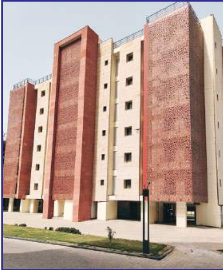
दिपुआनिलि द्वारा नया पुलिस मुख्यालय आवासीय परिसर में बालकनी पर व्यू-कटर स्थापित किया Installation of View-Cutter at balcony in the New PHQ Residential Complex by DPHCL